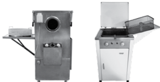
Die ersten Geräte der Marke Elframo