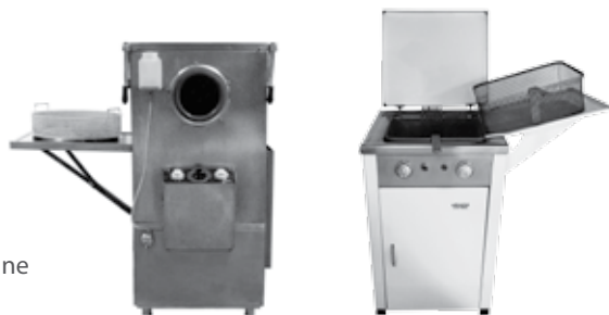
La première machine siglée elframo